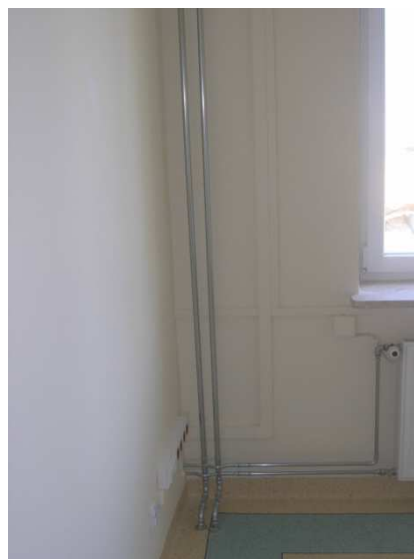
Zdjęcie nr 2 – korytka zakrywające przewody sieci LAN