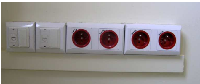
Zdjęcie nr 1 – przyłącza sieci LAN

UWAGA! – konkretne rozmieszczenie kamer na zewnątrz budynku jest uwarunkowane umiejscowieniem sieci LAN, na której należy w pierwszej kolejności opierać sposób podłączenia i zasilania. Połączenia pomiędzy budynkami należy wykonać w oparciu o 4 osobne tory światłowodowe (połączenie IP możliwe jako podsieć VLAN w sieci PSTD).