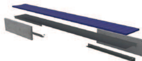
Rys. Widok w perspektywie – układ elementów.

W zależności od uwarunkowań i wielkości przedpola, należy proporcjonalnie dostosować długość ławki, pamiętając że układ jest trójdzielny i podpory zawsze stanowią 1/3.